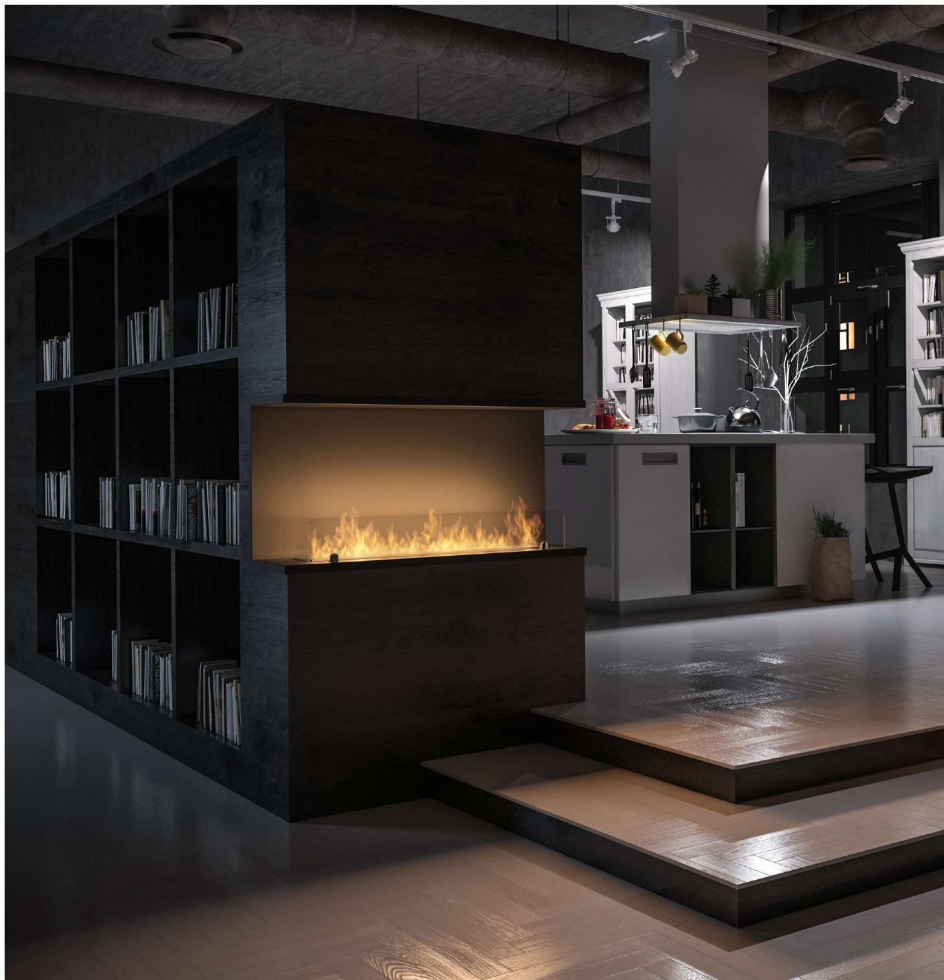
Biokominek Inside C1000v2