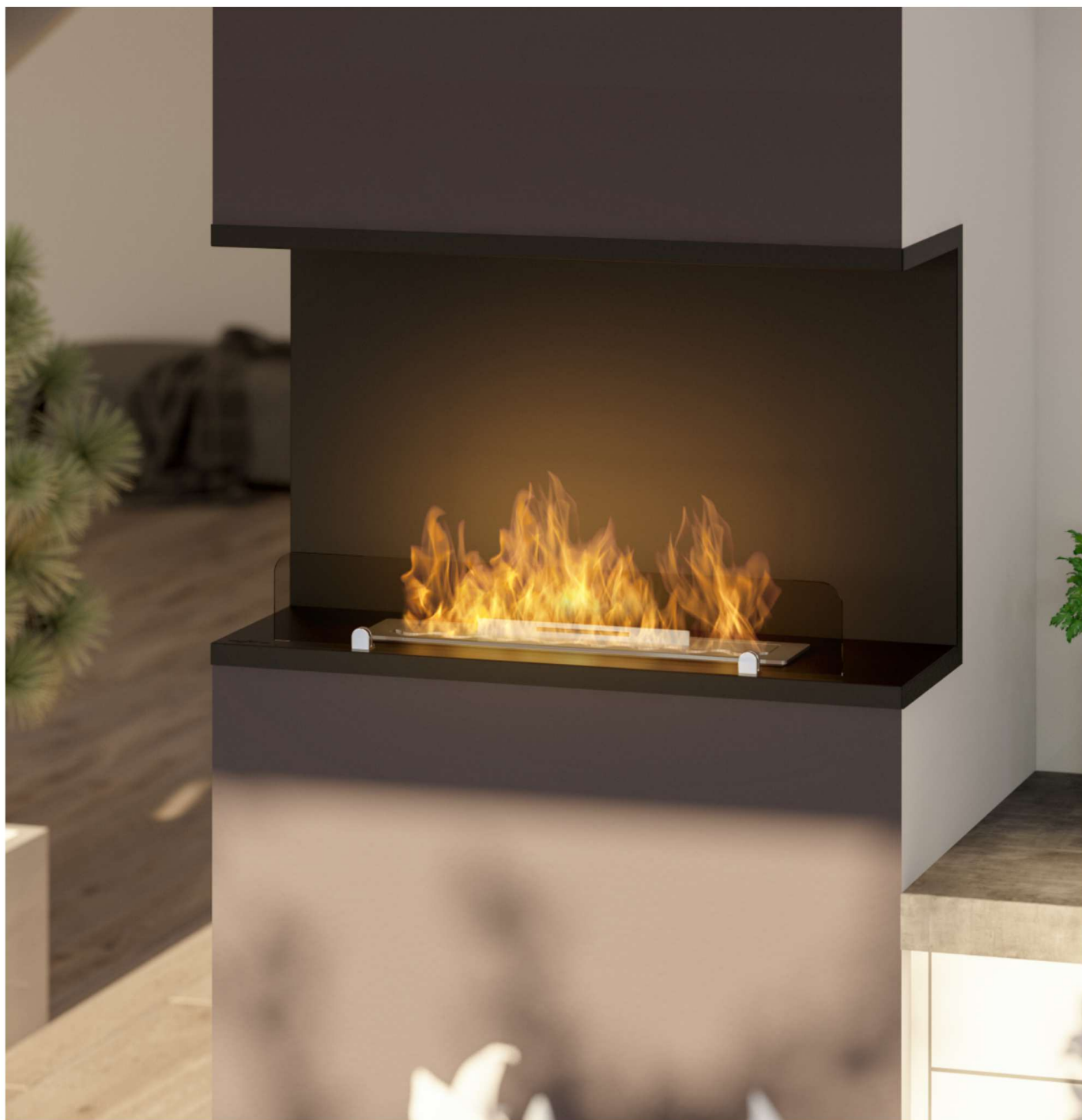
Biokominek Inside C800v2