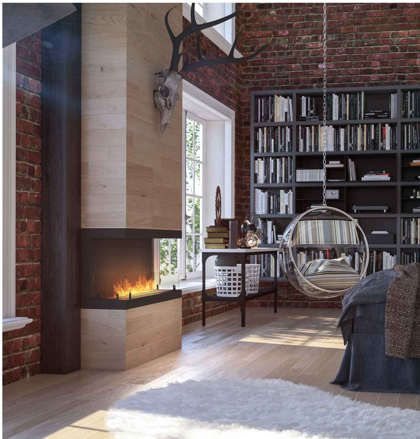
Biokominek Inside C1000v3