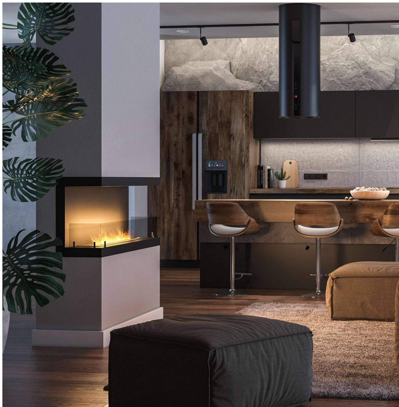
Biokominek Inside C1200v3